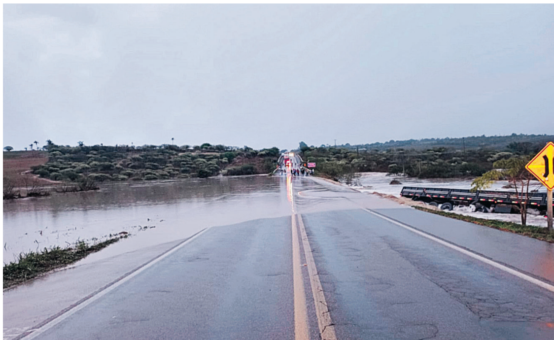
Um trecho da rodovia BR-423, na altura de Jupi, foi interditado devido ao alagamento

ocorrência foi registrada por volta das 3h45, quando a pista ficou encoberta pela água. Já o governo do estado afirmou que está garantindo o acesso provisório à PE-182, em Jucati, que teve parte da sua estrutura danificada. Além disso, anunciou uma obra provisória de acesso alternativo à PE-158, em Calçado, que teve comprometimento na ponte de acesso à cidade.